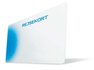
Udrulning Sjælland pr. 1. februar 2011